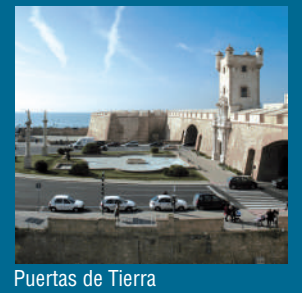
Puertas de Tierra