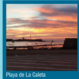
Playa de La Caleta