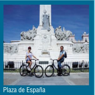
Plaza de España