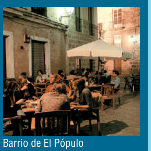
Barrio de El Pópulo