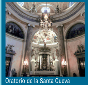
Oratorio de la Santa Cueva