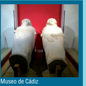
Museo de Cádiz