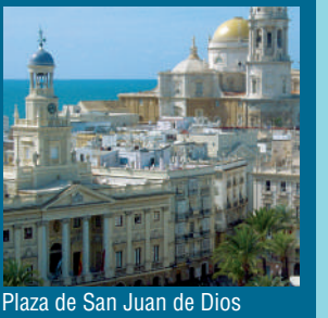
Plaza de San Juan de Dios