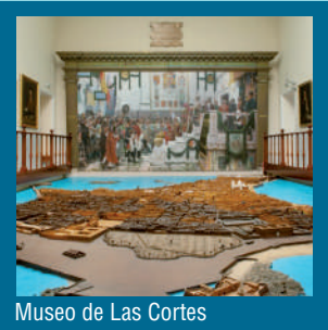
Museo de Las Cortes